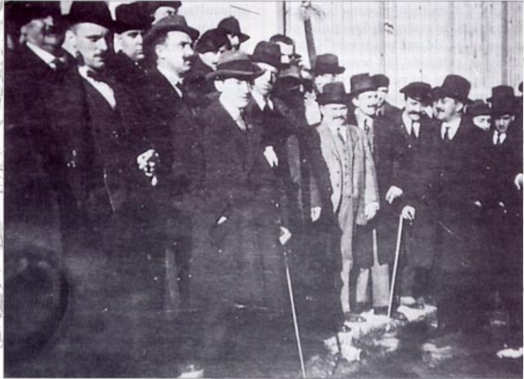
Asemblea de Lugo de 1918

No ámbito político, as Irmandades defenderon unha "autonomía integral" dentro dunha federación ibérica en igualdade de relacións con Portugal , o ingreso das nacionalidades da península na Liga das Nacións, a desaparición das deputacións e a constitución dun Parlamento e dun Goberno propios que exerceran o poder galego. Da súa primeira reunión conxunta, que tivo lugar en Lugo en 1918, sae un manifesto considerado o documento fundacional do nacionalismo galego.