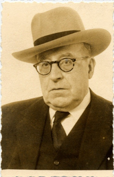
Ramón Otero Pedrayo