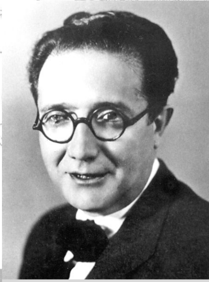
Afonso Daniel Rodríguez Castelao