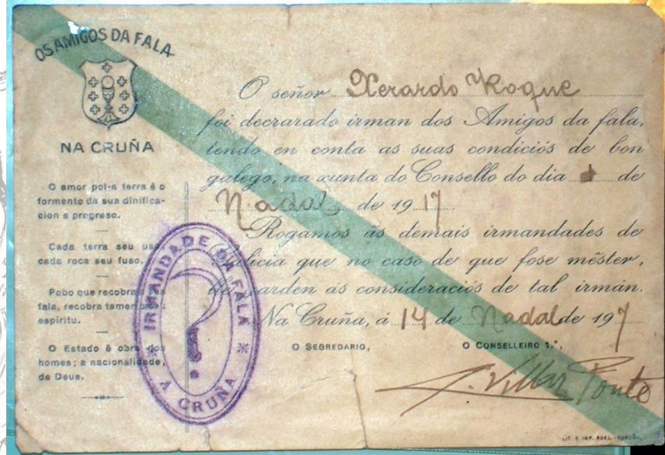
Documento de pertenza ás Irmandades asinado por Vilar Ponte

Os irmáns Vilar Ponte, Losada Diéguez, Vicente Risco ou Ramón Cabanillas foron as cabezas visíbeis dun movemento que demandou a galeguización plena da sociedade. Tras a constitución da primeira sociedade na Coruña (1916) , o movemento espallouse rapidamente por toda Galiza. No transcurso da súa acción deron conferencias e promoveron a actividade editorial nas principais cidades galegas, que se concreta en iniciativas como Céltiga en Ferrol, Lar na Coruña, Alborada en Pontevedra. Crearon a revista A Nosa Terra , que foi o seu medio de comunicación desde o que deron a coñecer os seus ideais.